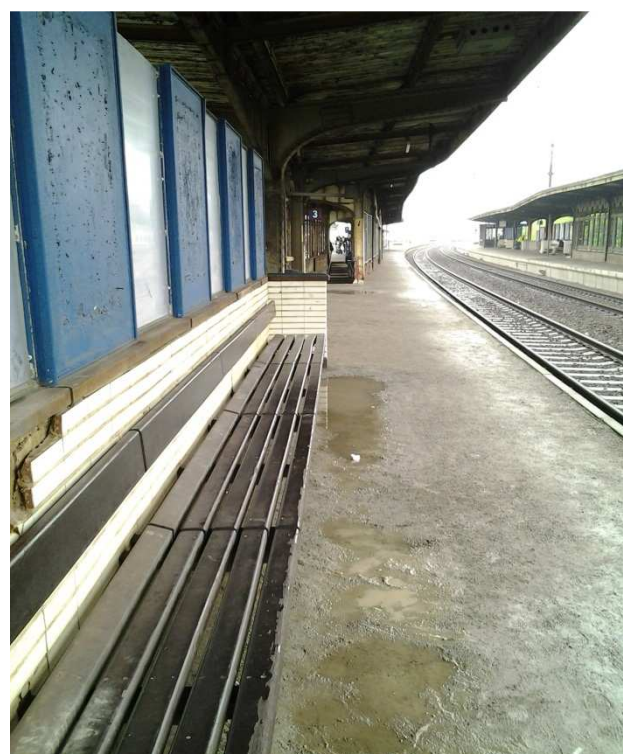
Vilvorde – Assis les pieds dans l'eau sans indicateurs