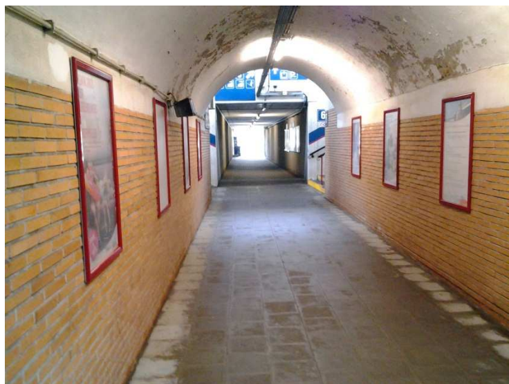
Vilvorde - Tunnel sous voies