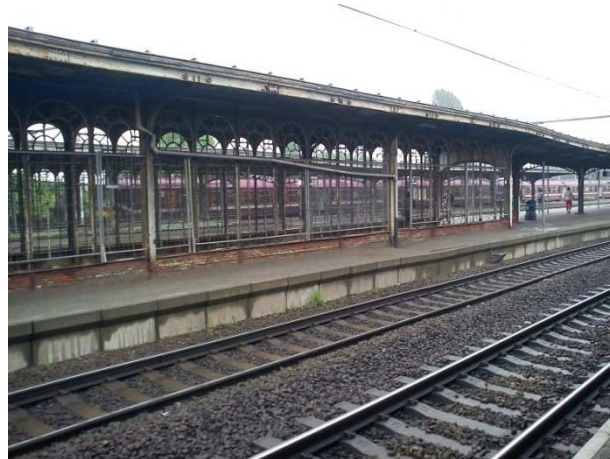
Vilvorde – Vision depuis les quais

Le CCU déplore que cette constatation peut s'appliquer à l'heure actuelle à bon nombre d'autres gares en Belgique. Le cas de Vilvorde ne serait donc pas une exception à la règle.