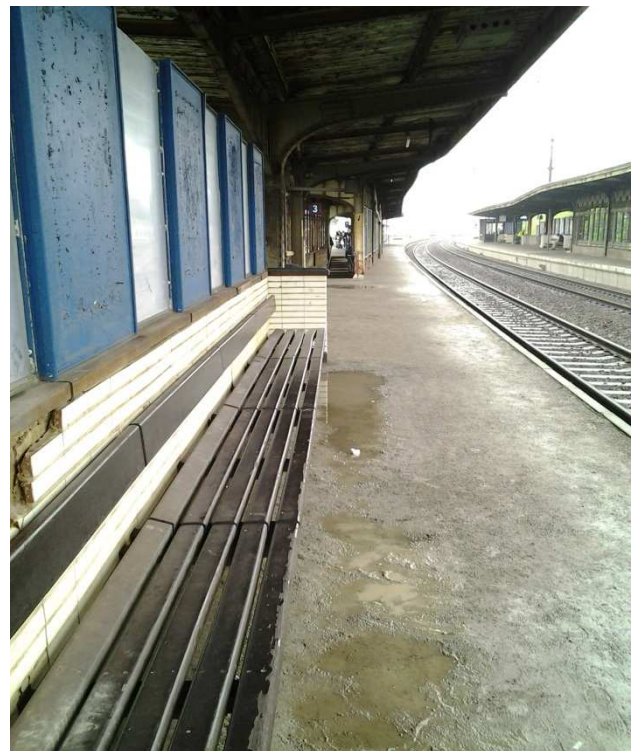
Vilvoorde – De voeten in het water en geen aanduidingsborden