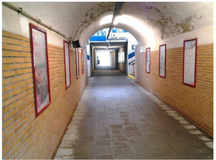
Vilvoorde – Tunnel onder spoorwegen