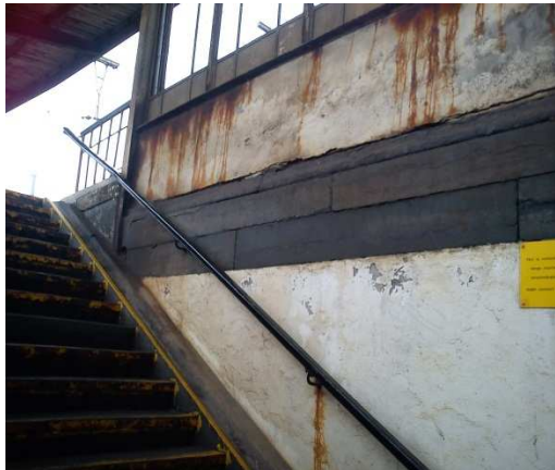
Vilvoorde – Visie van de trappen