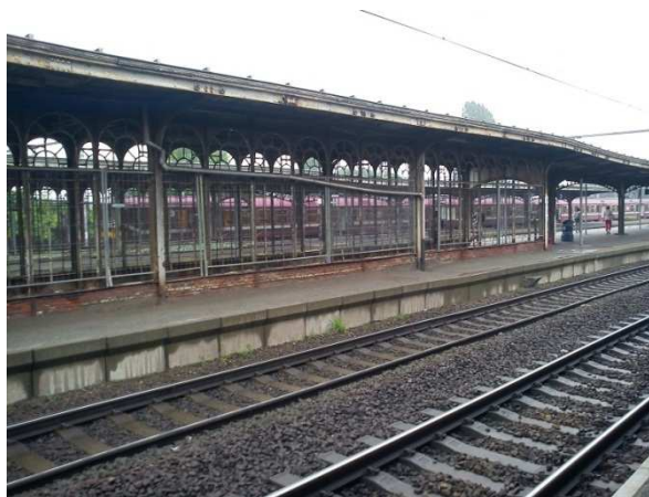
Vilvoorde – visie van het perron

Het RCG betreurt dat deze vaststelling op dit moment voor een groot aantal andere stations in België geldt. Het geval van Vilvoorde zou dus geen uitzondering op de regel zijn.