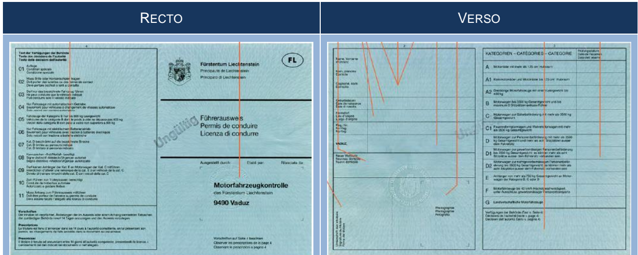
Afgeleverd in Liechtenstein van 01/01/1993 tot 31/03/2003